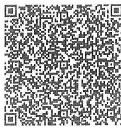
EFECTOS FISCALES AL PAGO

CFDI RELACIONADOS: ESTE DOCUMENTO ES UNA REPRESENTACION IMPRESA DE UN CFDI TIPO RELACIÓN: 07 - CFDI POR APLICACIÓN DE ANTICIPO CFDI RELACIONADO: C2410863-AAFE-4AC3-8F1D-FD0155891CEB